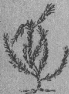
Yerba de la perdiz Parte usada: Planta completa sin la raíz.

Es además un astringente suave, diurético, febrífugo, carminativo y aperitivo. Se lo emplea en combatir la gonorrea y las hemorroides.