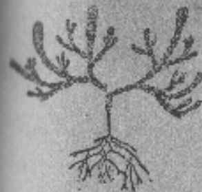
Cola de quirquincho

Crece con mayor abundancia en las Sierras de Achala y de Catamarca.