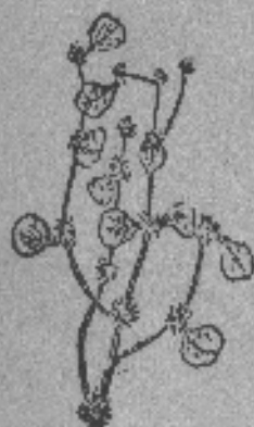
Yerba del pollo

Parte que se utiliza: Planta completa sin raíz.