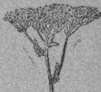
Mil en rama