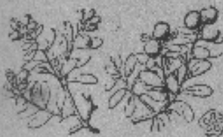
Gayuba o gaulla