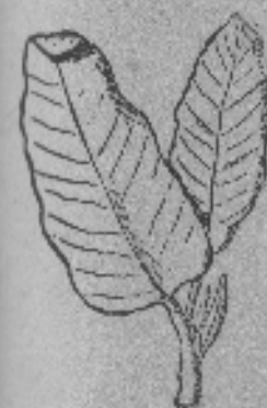
Lengua de vaca

Nombres vulgares: Lengua de Buey, Romaza roja, Ramosa, Paciencia, Hualtata.