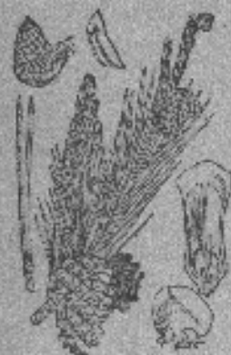
Yemas de pino

Parte utilizada: Las yemas (brotos nuevos).