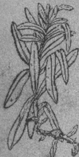
Vira - Vira

Nombre científico: GNAPHALIUM CHEIRANTHIFOLIUM LAM. GNAPHALIUM CITRINUM HOOK ET ARN. GNAPHALIUM LUTEO-ALBUM L. COMPUSTAS