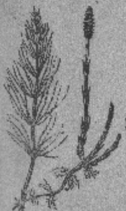
Cola de caballo

Crece espontáneamente en San Juan, Catamarca, La Rioja, Córdoba, Corrientes, Entre Ríos, etc.