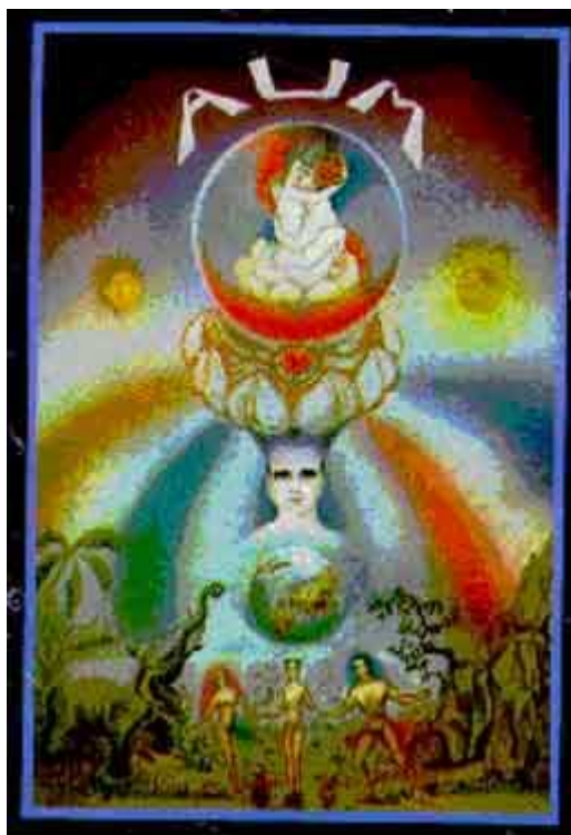
A Primeira carta do Tarô. Explicação do seu simbolismo.

Os reinos mineral, vegetal a animal, estão simbolicamente expressos na parte inferior da carta.