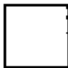
Prithivi - Quadrado Amarelo

Já dissemos que o princípio do ar não representa propriamente um elemento em si, a essa afirmação vale também para o princípio da terra. Isso significa que, do efeito alternado dos três elementos mencionados em primeiro lugar, o elemento terra formou-se por último, pois através de sua característica específica, a solidificação, ela integra em si todos os outros