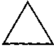
Tejas - Triângulo Vermelho

Como tivemos oportunidade de mencionar, o Akasha, ou Princípio Etérico, é a origem da criação dos elementos. O primeiro elemento que de acordo com os escritos orientais nasceu do Akasha, é Tejas, o princípio do fogo. Esse elemento, como todos os outros, não age só em nosso plano denso, material, mas em tudo o que foi criado. As características básicas do princípio do fogo são o calor e a expansão; é por isso que no começo da criação tudo era fogo a luz. A bíblia também diz: "Fiat lux - que se faça a luz". Naturalmente a base da luz é o fogo. Cada elemento, inclusive o fogo, possui duas polaridades, a ativa e a passiva, Le., Plus e Minus (mais e menos). A Plus é a construtiva, criadora, geradora, enquanto que a Minus é a desagregadora, exterminadora.