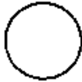
Waju - Círculo Azul

Outro elemento que se formou a partir do Akasha é o ar. Os iniciados encaram esse princípio não como um elemento real, mas colocam-no numa posição intermediária entre o princípio do fogo e o da água; o princípio do ar, como meio, por assim dizer, produz um equilíbrio neutro entre os efeitos passivo a ativo do fogo a da água. Através dos efeitos alternados dos elementos passivo a ativo do fogo a da água, toda a vida criada tomou-se movimento.