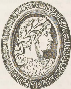
Ovales Gussmedaillon in braun patinirtem orientalischen Gelbkupfer. Höhe 40, Breite 32 mm.

In dem ‚Führer durch die Ausstellung‘ in der Sammlung der Papyrus Erzherzog Rainer habe ich S. 96 den Urkunden aus der Zeit der Gesammtherrschaft der Söhne Constantins des Grossen als Schlussvignette das nachstehend abgebildete Bronze-medailleon beigegeben. Die Erscheinung dieses Stückes ist so singulär, dass seine Besprechung, welche an dem genannten Orte dem ausschliesslichen Zwecke als bildlicher Schmuck nicht